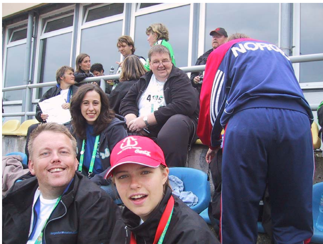
Norwescy sportowcy biorący udział w Olimpiadzie Specjalnej w Warszawie