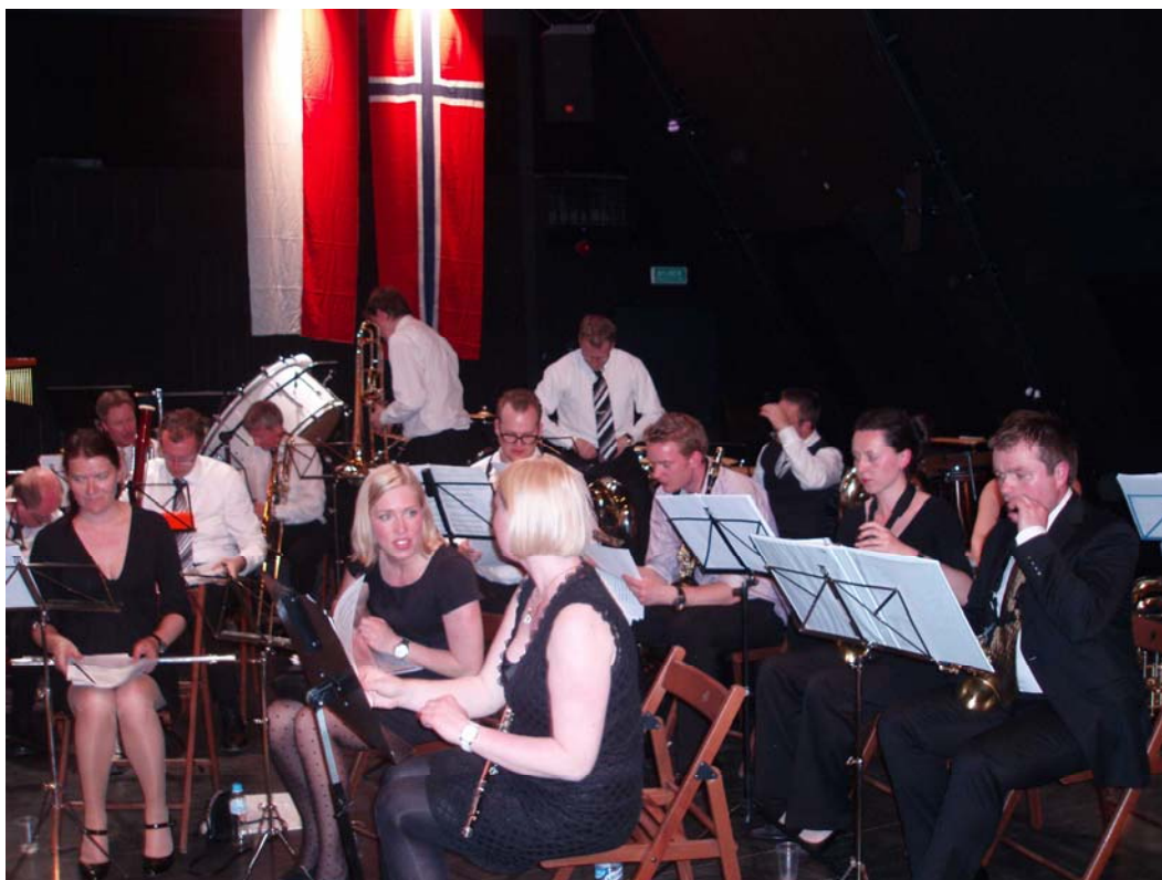
Orkiestra Lillestrøm Musikkorps w czasie koncertu z okazji 50-lecia Towarzystwa Polsko-Norweskiego, Centrum Sztuki Współczesnej Zamek Ujazdowski, 21 maja 2010